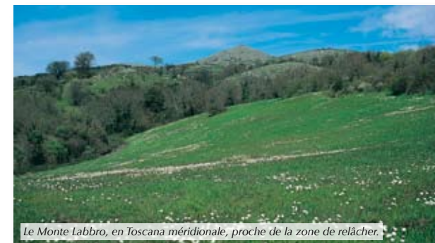
Le Monte Labbro, en Toscana meridionale, proche de la zone de relâcher.