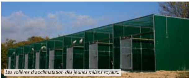
Les volières d'acclimatation des jeunes milans royaux.

Après deux à trois semaines les volières seront ouvertes et les jeunes pourront s'envoler libres. Le relâché sera précédé d'un approvisionnement d'un charnier d'alimentation proche des volières et de deux autres distants de six kilomètres.