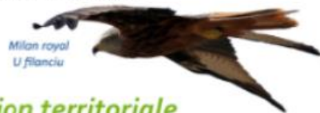
Milan royal U. flanciu

Plusieurs Plans Nationaux d'Actions (PNA) sont mis en oeuvre par le Conservatoire, notamment pour le milan royal, le crapaud vert et le goéland d'Audouin. Il participe également à d'autres travaux scientifiques et techniques notamment sur les zones humides.