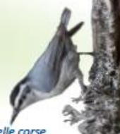
Sittelle corse A pichjarina