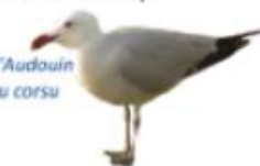
Goéland d'Audouin Gabbianu corsu