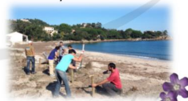
Chantier d'automne sur la plage de Favone, 2015. Mise en place d'une zone refuge de la Buglosse crépue (plante endémique corso-sarde, rare et protégée).