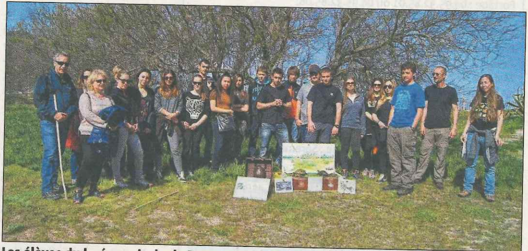
Les élèves du lycée agricole de Borgo ont arpenté les hectares du site du Rizzanese.