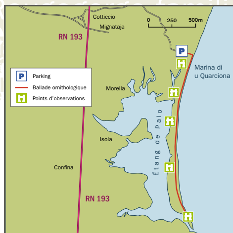
Carte du site (sachant que la balade s'effectue sur le littoral (départ du parking/bord de mer))

Nous vous proposons ce parcours afin de découvrir les oiseaux de l'étang de Palo (Haute-Corse/Ventiseri). Cette zone humide, domaine du Conservatoire du Littoral gérée par le département de Haute-Corse est inscrite aux sites RAMSAR, elle abrite toute l'année un cortège remarquable d'oiseaux d'eau hivernants et nicheurs (Canards, Grèbes, Hérons et compagnie...).